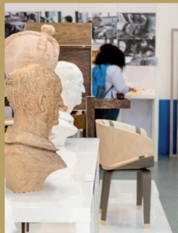
Ecole Boullu, invité d'honneur de l'édition 2017 de la Fête des Métiers d'Art

La fête des métiers d'art prolonge la transmission des savoir-faire locaux autour du travail des métaux, valorise des entreprises normandes et renforce la notoriété de Villedieu-les-Poêles comme CITÉ NORMANDE DES MÉTIERS D'ART .